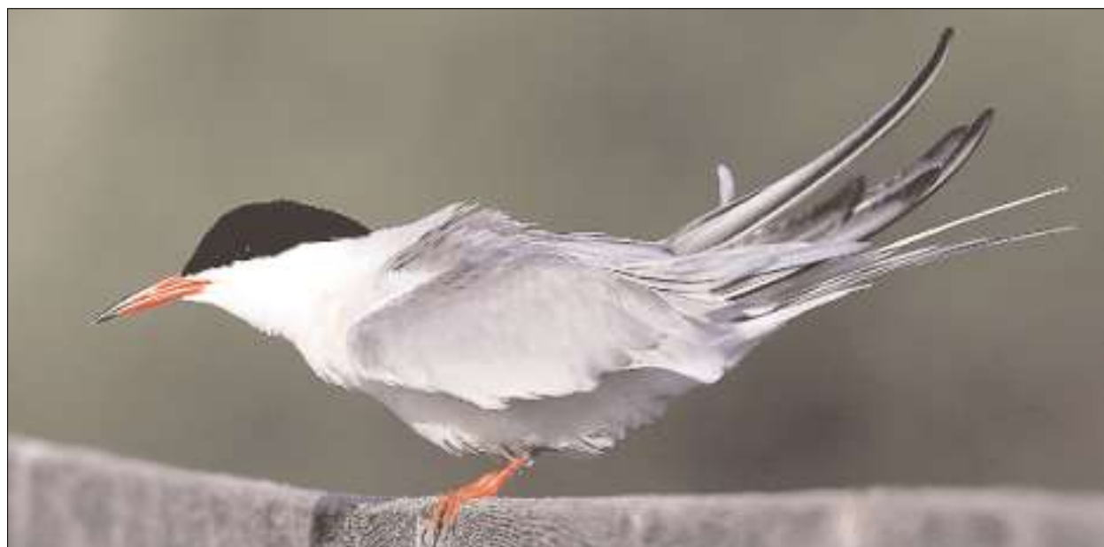
Ein eleganter Vogel: Die Flusseeeschwalbe auf dem Geländer des Fussgängerholzstegs. (Beat Walser)

Vogelwarte Sempach, dem Natur- und Vogelschutzverein Rapperswil-Jona und der cnlab AG realisiert. (e)